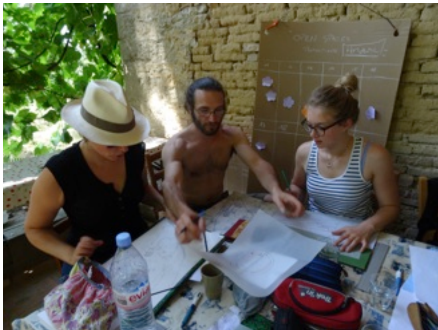
Exercice de design : l'acquisition de la méthode et l'apprentissage du design à partir des possibilités du site sont au coeur de la formation

la démarche de transition nécessaire au bon fonctionnement d'une société durable, et ce dans le respect des écosystèmes naturels.